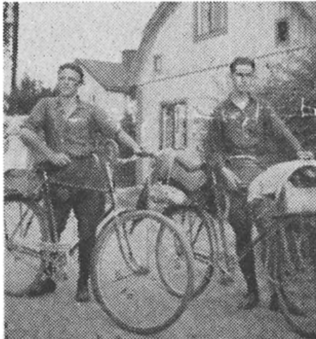
En av de röda-cykelpatrullerna startar på turné.