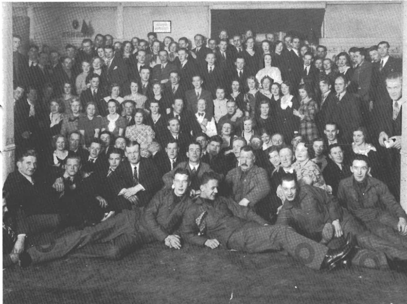
Ett av förbundets Mälarting på 30-talet. Lägg märke till förgrundsgestaltarnas overaller med röda ringar på.

När SAC bildades 1910 var de flesta medlemmarna unga och något behov av ett ungdomsförbund gjorde sig inte omedelbart påmint. 1918 togs saken upp till diskussion i tidningen Syndikalisten (föregångaren till Arbetaren) varefter den debatterades på kamratmöten och andra sammankomster samt i tidningsartiklar.