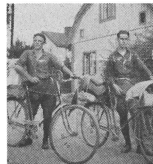
En av de röda-cykelpatrullerna startar på turné.