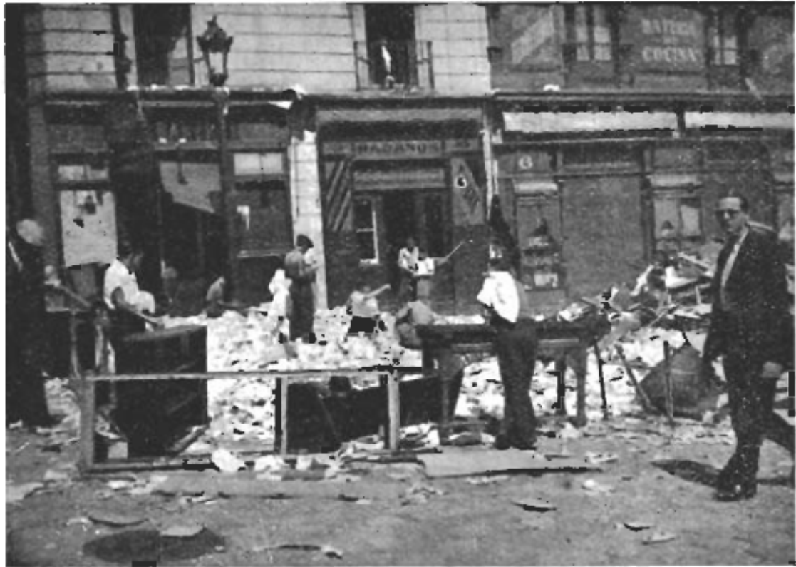
Ett fascistnäste i Barcelona som rensas ut ordentligt.