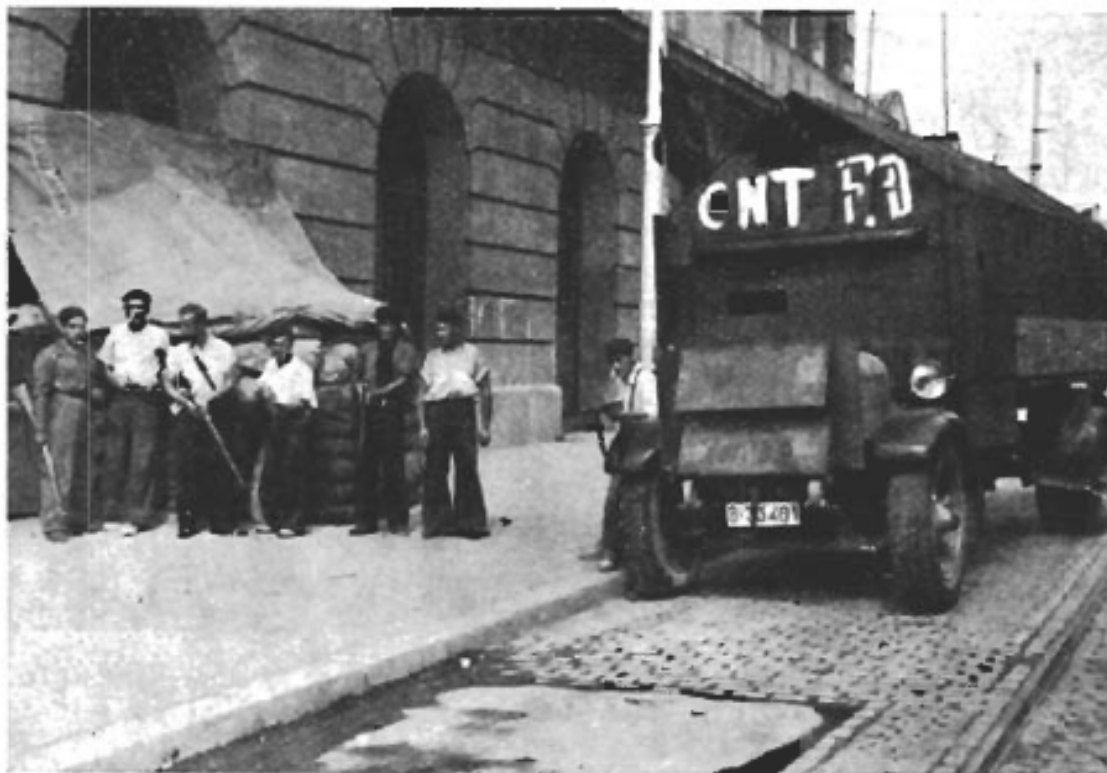
Milis med provisorisk pansarbil klara till strid.

Men samtidigt som arbetarna socialiserade industri och jordbruk fortsatte den väpnade kampen ute vid fronterna. Utan inblandning hade striden snart varit avgjord. Men Tysklands och Italiens öppna stöd åt fascisterna förlängde och försvårade striden. Arbetarna saknade vapen och ammunition. Man arbetade för fullt vid ammunitionsfabrikerna i Madrid. Arbetet gick dygnet runt i fyra skift, men man förmådde ändå inte framställa tillräckligt med ammunition. Vid CNT:s verkstäder i Barcelona framställdes pansarbilar och bomber.