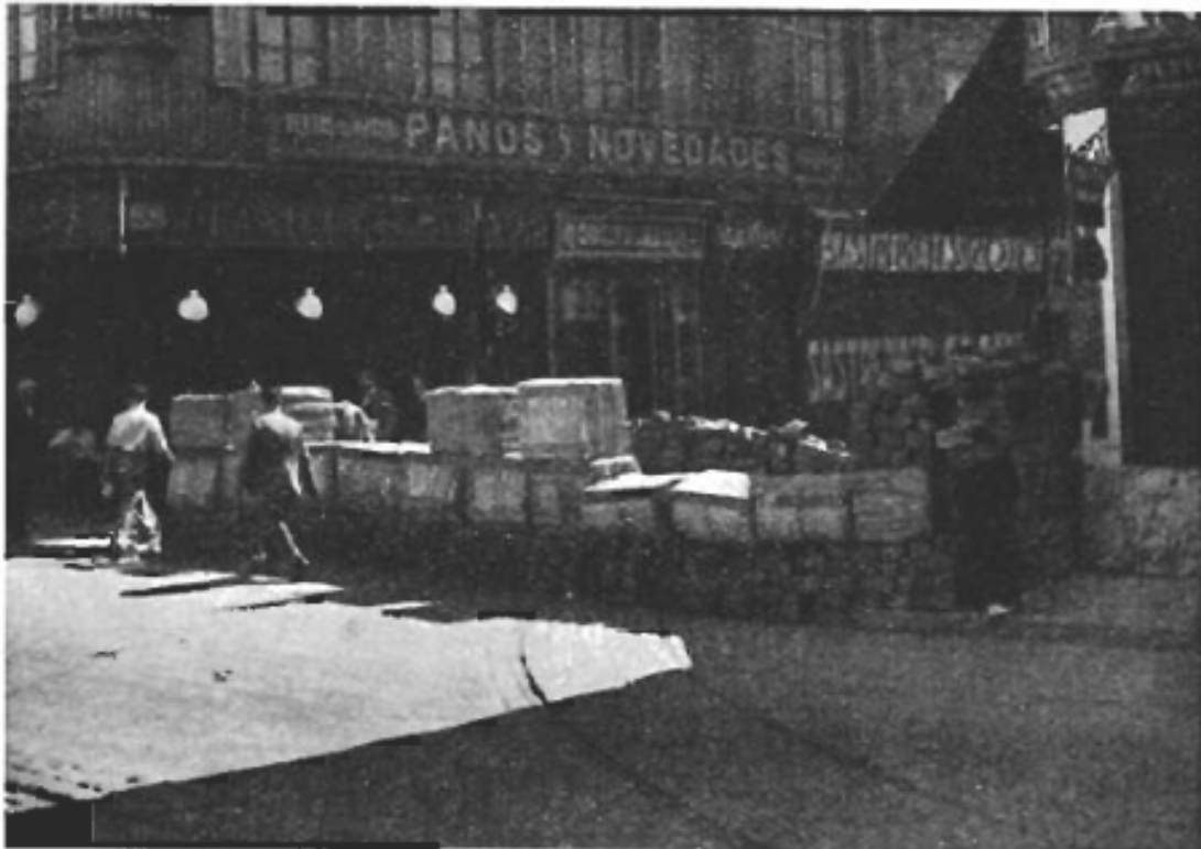
En barrikad utanför arbetarnas tidnings- och bokförlagslokaler.

Kataloniens anarkosyndikalister ha sina egna traditioner - liksom folket i Katalonien till språk och seder skiljer sig från det övriga Spanien. I Katalonien har alltid anarkosyndikalismen haft sina största försänkningar, den har alltid varit ett med folket självt. Liksom Kataloniens folk tidigare under århundraden fört en envis kamp för sin autonomi, så har det under snart ett århundrade kämpat under de anarkosyndikalistiska banéren för den absoluta friheten. Det är därför inte underligt att Katalonien blev den provins där fascismen fortast krossades, och det är inte heller underligt att det blev just Katalonien som gick i spetsen för det sociala uppbyggandet bakom fronten.