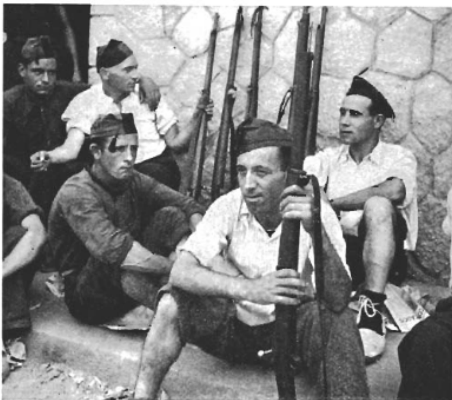
Övre bilden: Arbetarmilis i strid vid Zaragoza. Nedre bilden: I väntan på utryckningsorder.