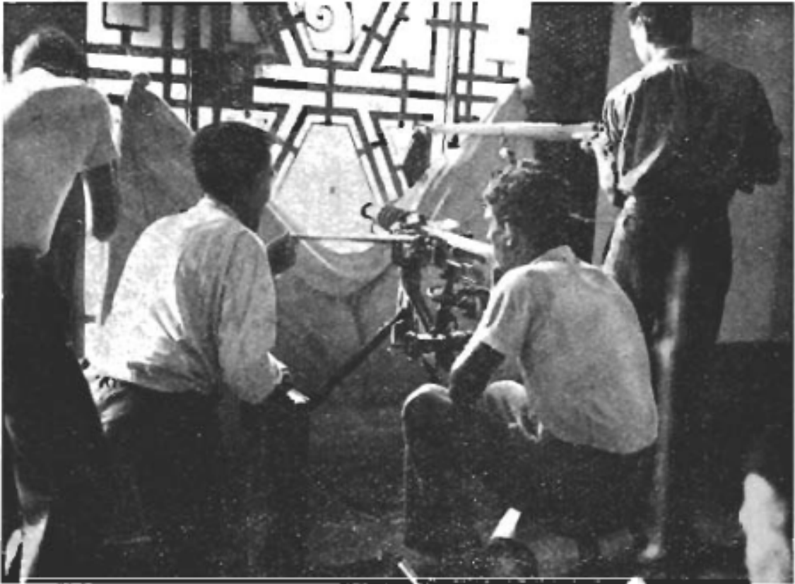
Efter intagandet av CASA-byggnaden, som nu är CNT:s huvudkvarter.