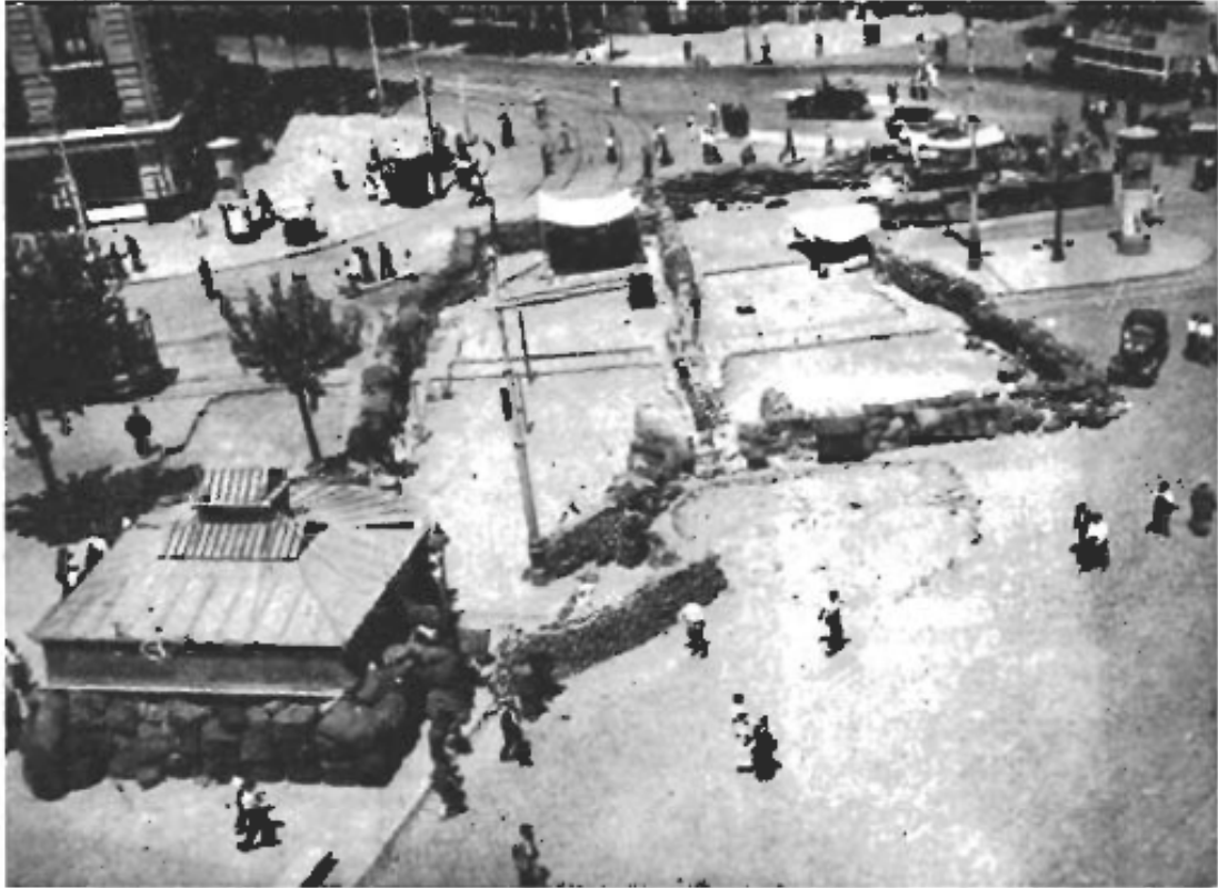
Arbetarnas barrikader i Barcelona den 19 juli 1936.