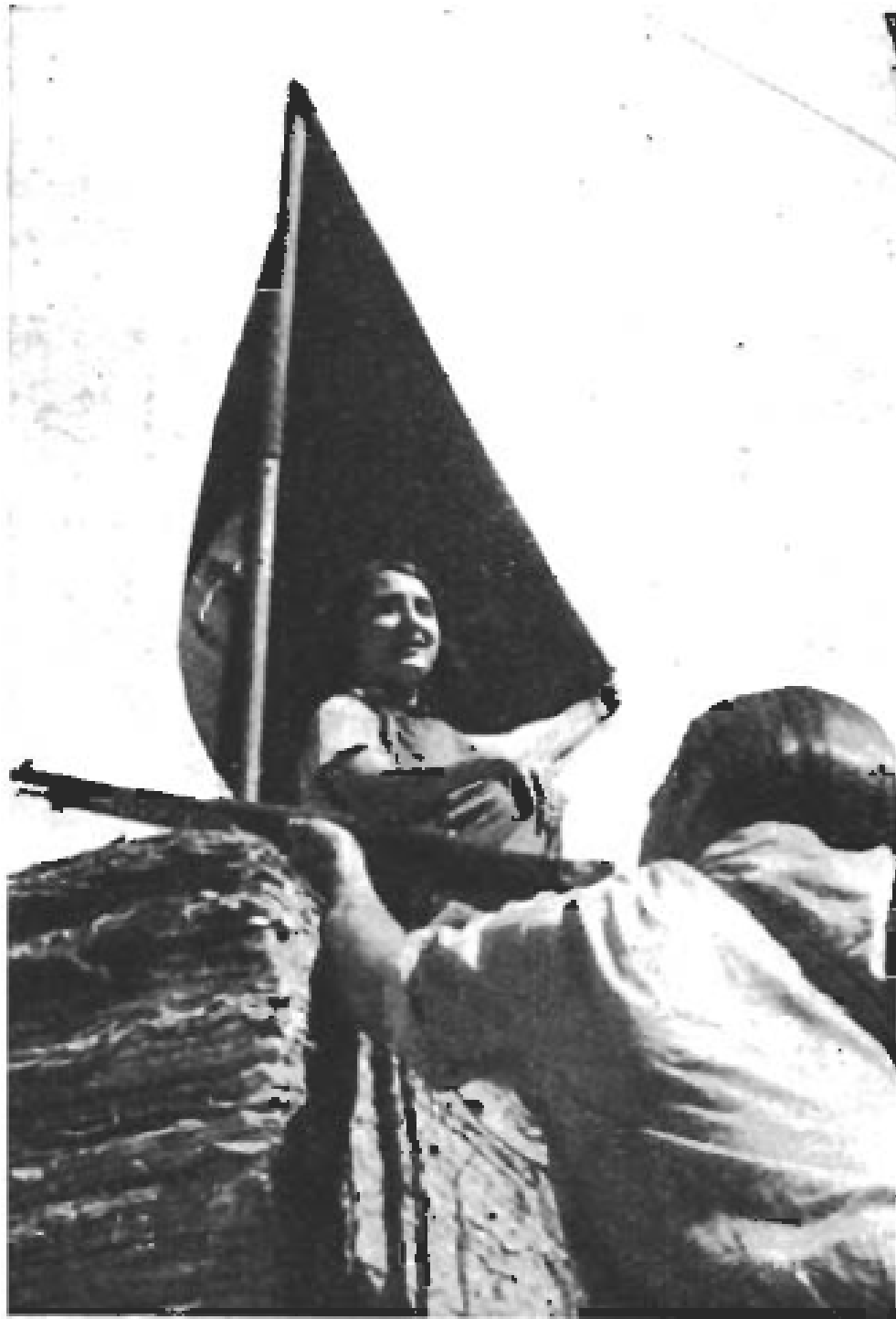
Under CNT:s och FAI:s svartröda fana.