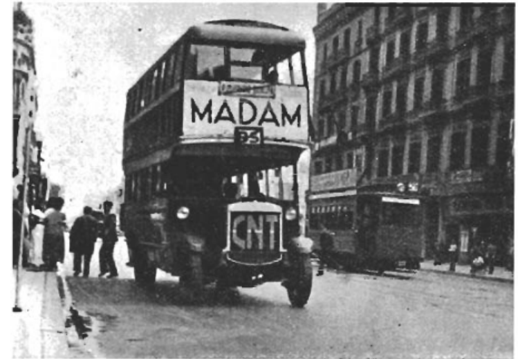
Bilderna visa ett par ex. på den produktiva aktivitet som i trots av inbördeskrigets brand ändå kännetecknar Spanien. Den övre bilden visar en modern pansarbü levererad av de stora verkstäder som helt övertagits av CNT och UGT syndikat och en trafikkbuss från samma fabrik synes på den nedre.

Generalidad hade mot sin vilja påskyndat denna utveckling. När mobiliseringen genomfördes visste Generalidad mer än väl att detta var i strid med CNT:s vilja. CNT krävde att inga nya militära kårer skulle uppsättas utanför arbetarnas kontroll. Trots detta gjordes försök att mobilisera även i Katalonien. Men när rekryterna nästan omedelbart efter inryckningen till Barcelona övergävo kasernerna och läto inskriva sig i CNT:s arbetarvårn, då var CNT:s seger fullständig, och för Generalidad fanns det inget annat att göra än att ställa sig CNT:s beslut till efterrättelse. Därmed var regeringen slutgiltigt satt ur spel, och miliskommittén, bestående av representanter för alla antifascistiska organisationer, blev den institution som vid sidan av CNT:s syndikat innehade den reella makten. I de partipolitiska arbetarlägren höjdes röster för bildandet av en ren arbetarregering, men CNT bromsade upp. CNT ansåg att det inte var på sin plats att slåss om regeringsinnehavet så länge fascisternas kanoner dundrade i Guaderamma och Zaragoza. För Kataloniens vidkommande fanns det inte heller någon anledning till detta, så länge som regeringen nöjde sig med sin skentillvaro.