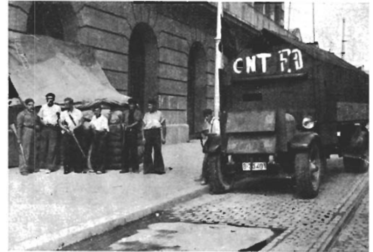
Milits med provisorisk pansarbil klara till strid.

pen i hand kämpa mot fascisterna. Lögnpropagandan i utlandet försvårade ytterligare deras ansträngningar. Importen av nödvändighetsvaror avspärrades och pesetan blev värdelös. Men trots detta lyckades det CNT och FAI att icke blott uppehålla en mönstergill ordning bakom fronten, utan också att lägga grundvalarna för det federalistiska samhället. Man erinrar sig förvirringen och oredan bakom fronten under den ryska revolutionen. Federalismen har redan bevisat sin överlägsenhet, federalismen har bevisat sin förmåga att under de mest svårartade förhållanden inte endast uppehålla och utvidga industrin. Arbetarnas övertagande av produktionen, utan mellanhänder och utan "proletariatets diktatur" har genomgått sitt eldprov och visat sig vara hållbar.