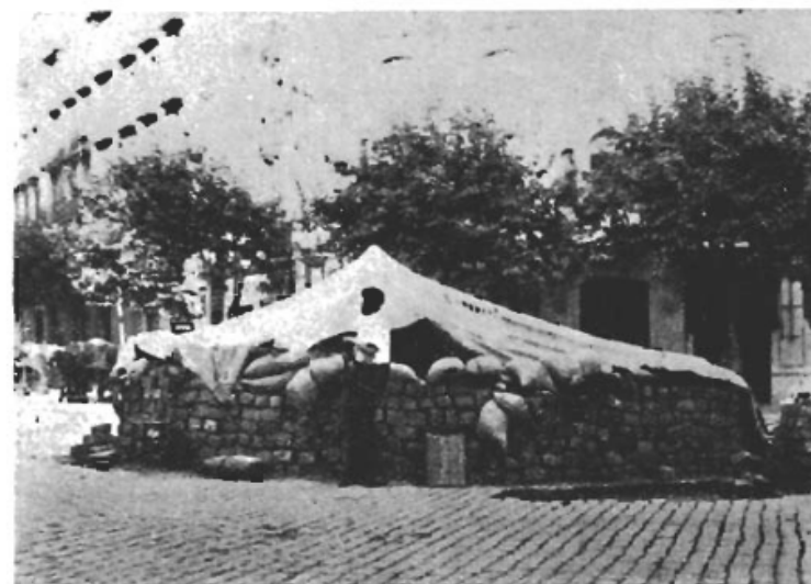
En barrikad utanför ett CNT:s Kem.-Tekn. Arb.-syndikats byggnad.