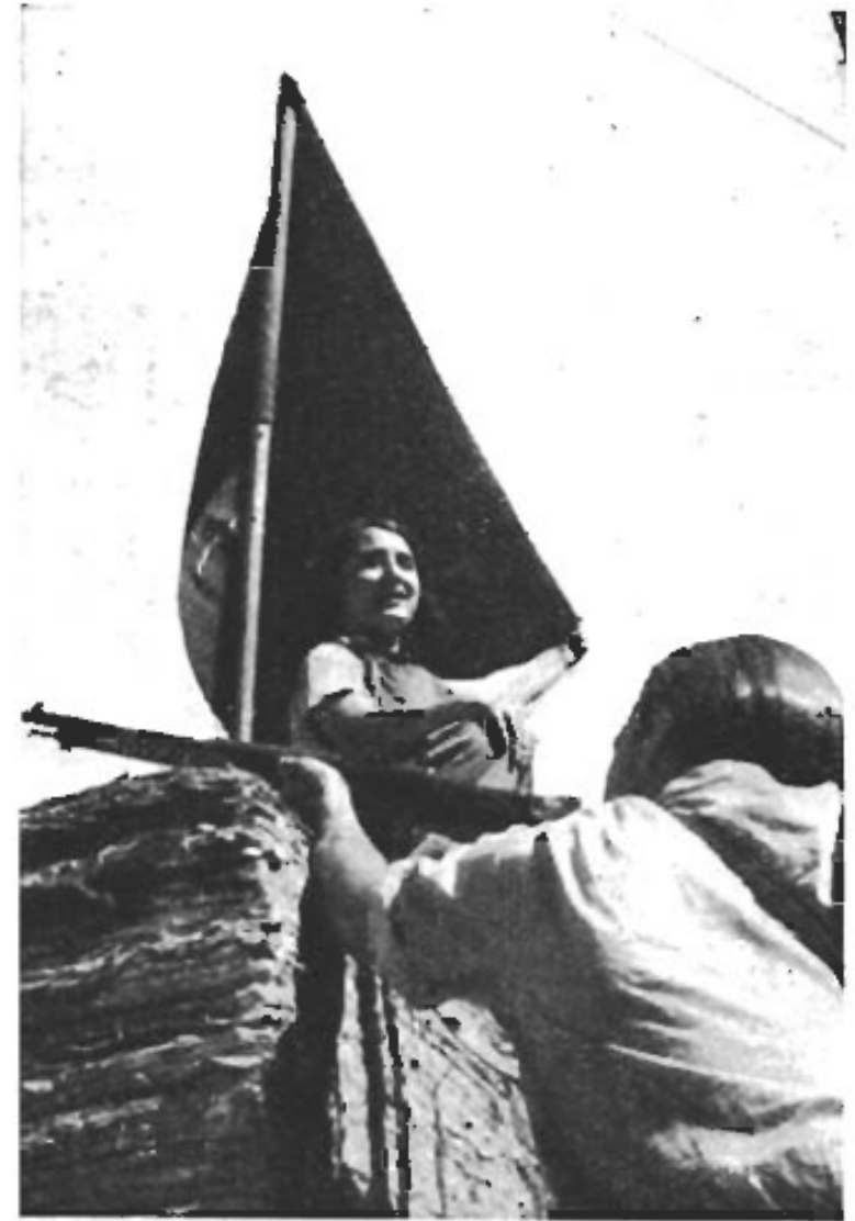
Under CNT:s och FAI:s svartröda fana.

Förklaringar: CNT betecknar den syndikalistiska landsorganisationen, Confederacion National del Trabajo (Nationella arbetarkonfederationen), UGT betecknar de spanska fackföreningarnas landsorganisation, Union General de los Trabajadores , (Allmänna arbetarunionen), FAI betecknar den anarkistiska organisationen, Federacion Anarquista Iberica , (Iberiska anarkistiska federationen).