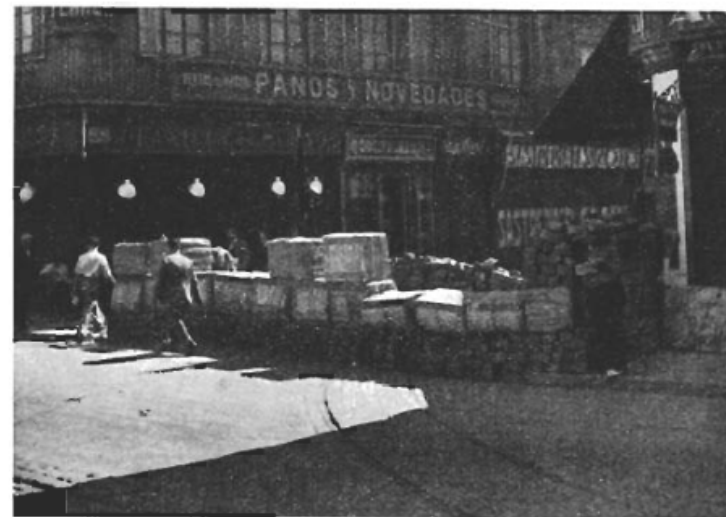
En barrikad utanför arbetarnas tidnings- och bokförlagslokaler.