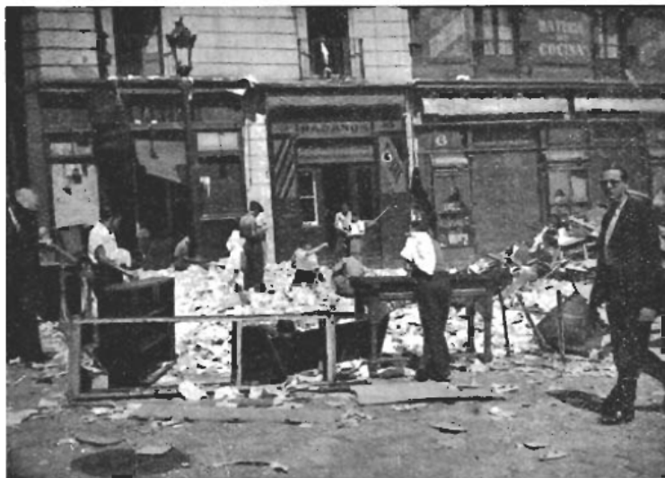
Ett fascistnäste i Barcelona som rensas ut ordentligt.

Folket, dåligt beväpnat, men med en flammande entusiasm, stormade kasernerna och erövrade vapenarsenalerna. Och därmed hade kampen kommit till en vändpunkt. Fascisterna behärskade en rad städer, Zaragoza, Sevilla, Granada, Burgos, Valladolid o. s. v., men arbetarna hade lyckats rädda de två viktigaste punkterna, Madrid och Barcelona. Och av dessa två städer blev det framförallt Barcelona beskärt att bli antifascismens högborg i den kommande kampen.