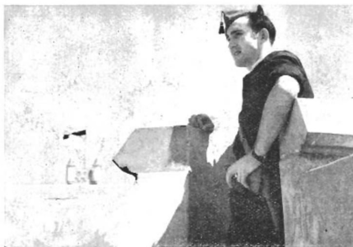
Den övre bilden visar lämningar av levande begravna människor funna i ett kloster av milisen. Att kloster och kyrkor utsatts för attacker beror helt därpå att de befanns vara armerade fästningar. "Präster som skjuts från kyrktornen på de lojala trupperna äro själva skulden till kyrkornas förstörelse", yttrade en framstående katolik vid en radiosändning från Madrid. Den undre bilden visar vaktjänsten mot just sadana överfall.