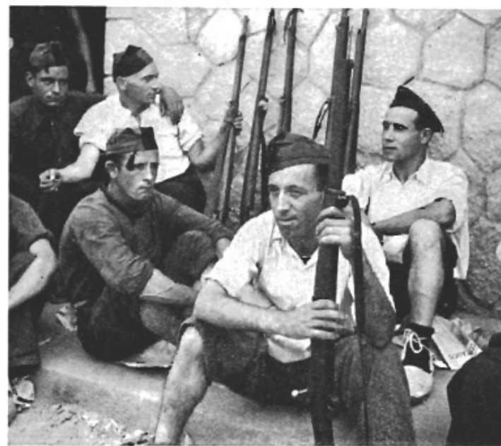
Övre bilden: Arbetarnas i strid vid Zaragoza. Nedre bilden: I väntan på utryckningsorder.