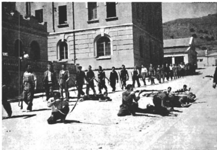
I Bakuninkasernen i Barcelona övas arbetarmilisen.

Generalidad lade inte heller några hinder i vägen för socialiseringen.