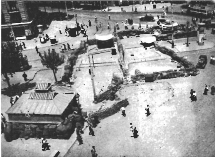
Arbetarnas barrikader i Barcelona den 19 juli 1936.