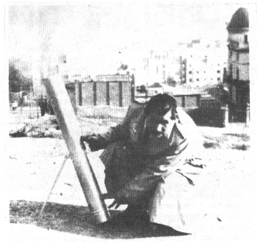
Francisco Sabate med en hemgjord granatkastare för att skjuta iväg anti-frankistiska flygblad. (Barcelona 1955).

nen CNT har spelat i oppositionen mot fascisterna. Dels genom väpnad kamp och dels genom organisering av arbetarna i en frihetlig fackförening uppbyggd från basen.